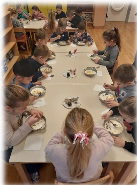
ZDRAV ZAJTRK-MLEKO, KOSMIČI IN OREŠČKI