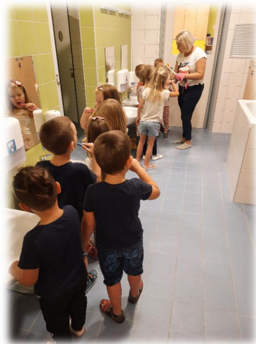
DEMONSTRACIJA UMIVANJA ZOB

ZDRAVA PREHRANA: otroci so spoznavali pomen raznolike prehrane in uživali veliko različnega, sezonskega sadja in zelenjave.