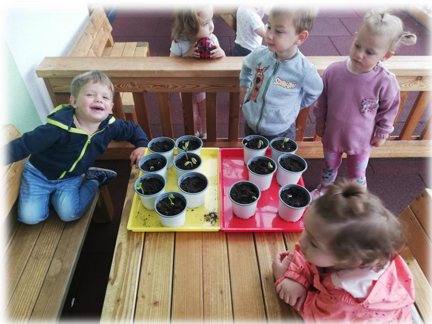
POSADILI SMO FIŽOL