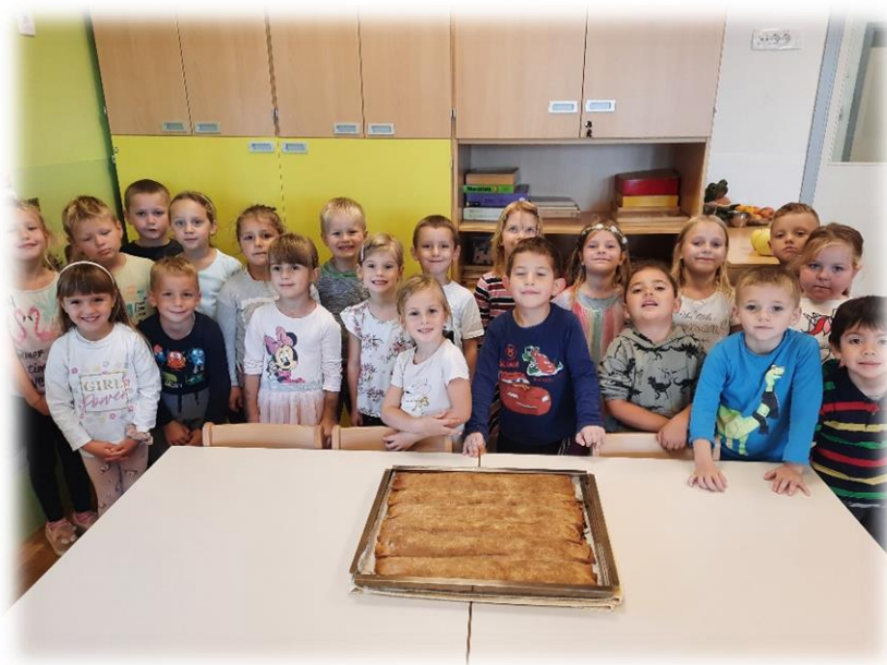
ZADIŠALO JE PO JABOLČNEM ZAVITKU