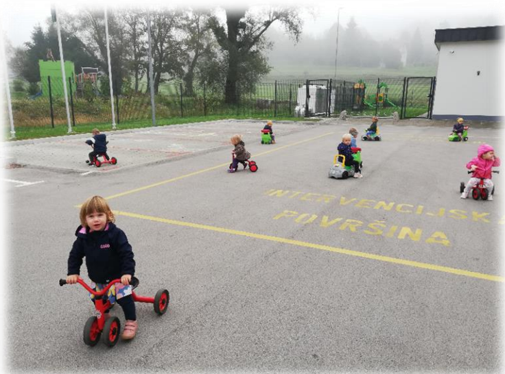
VOŽNJA S TRICIKLI IN POGANJALCI