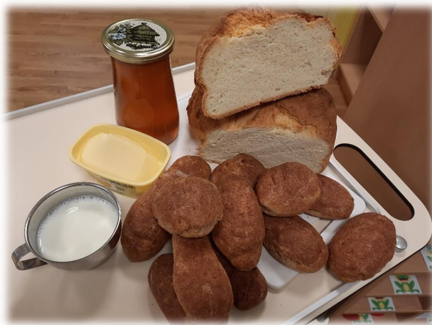
SPEKLI SMO KRUH IN PIRINE ŽEMLJE