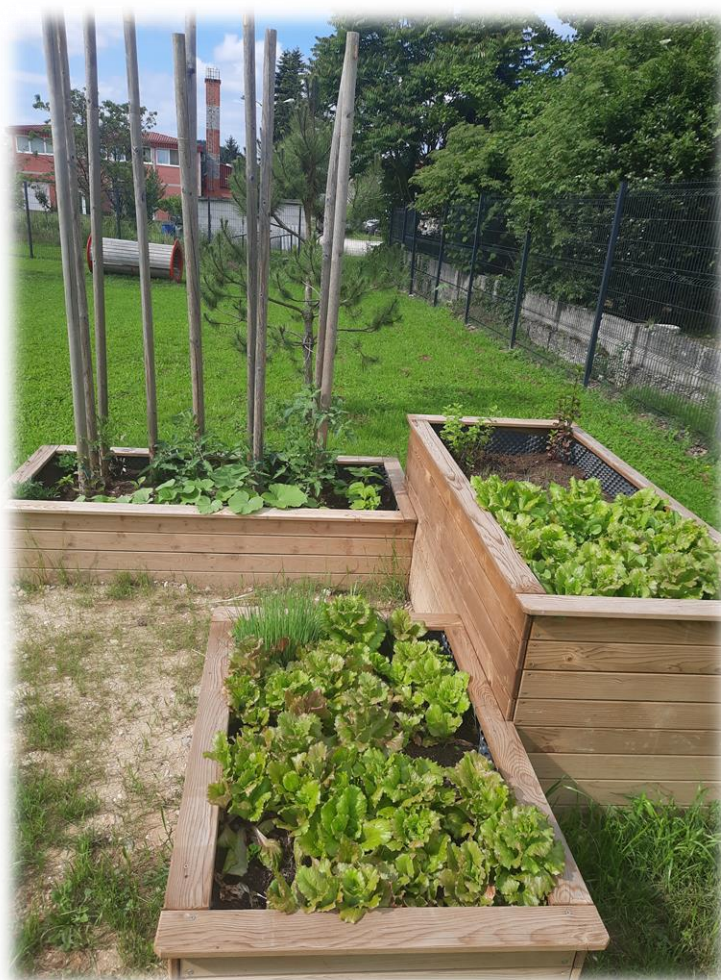
USPEH NAŠEGA DELA