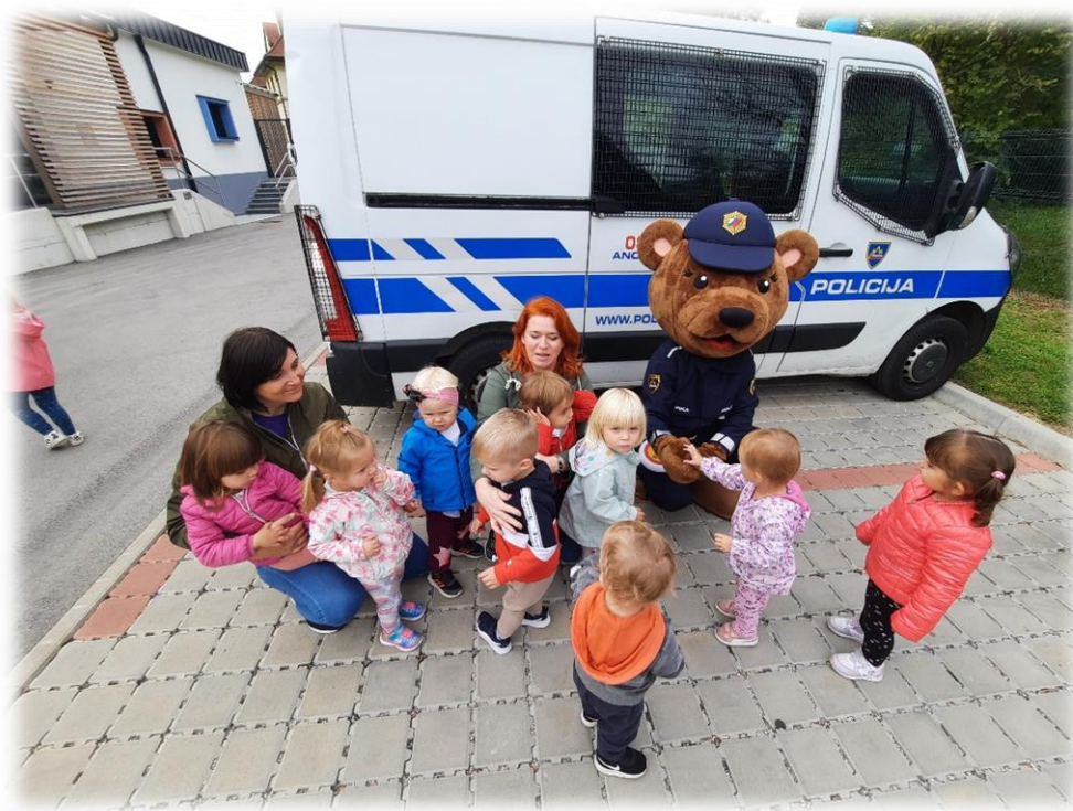
MEDO LEON NA OBISKU