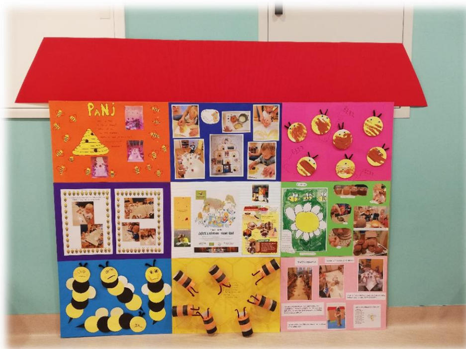
ČEBELNJAK DEJAVNOSTI OB TRADICIONALNEM SLOVENSKEM ZAJTRKU