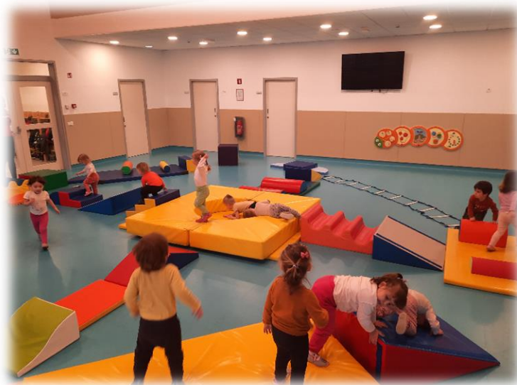
VADBENA URA V TELOVADNICI