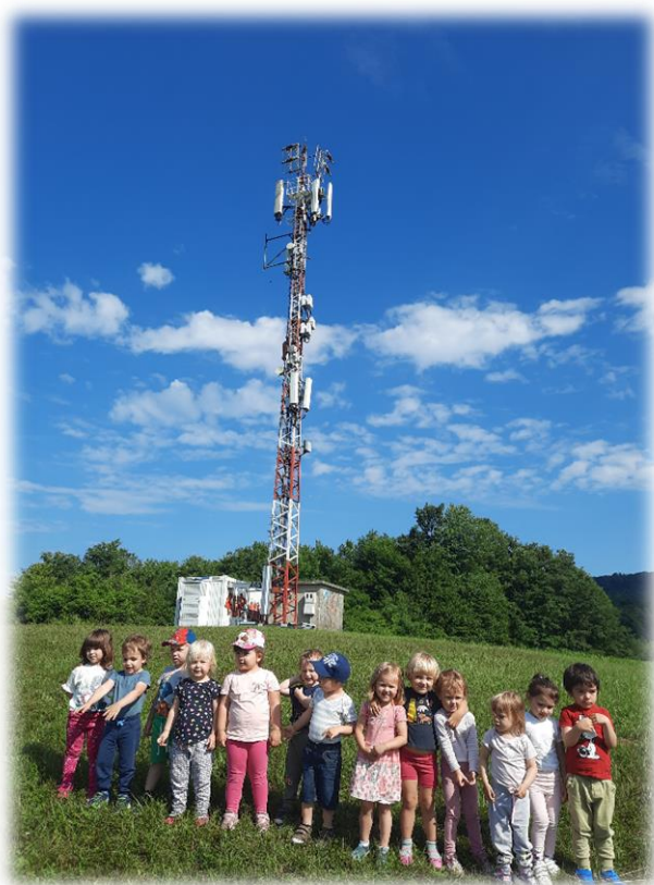
ČIČI HRIB OSVOJEN