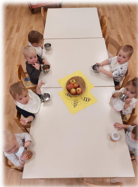
TRADICIONALNI SLOVENSKI ZAJTRK PRI NAJMLAJŠIH